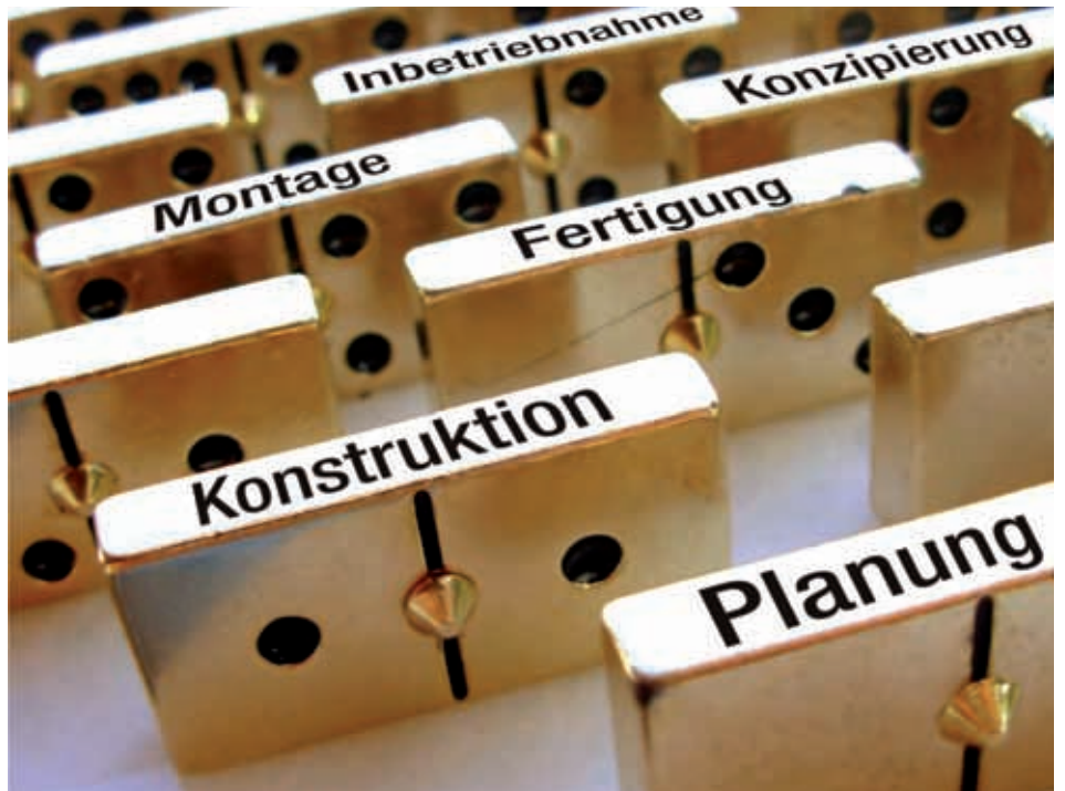
Ihre Bausteine zum Erfolg