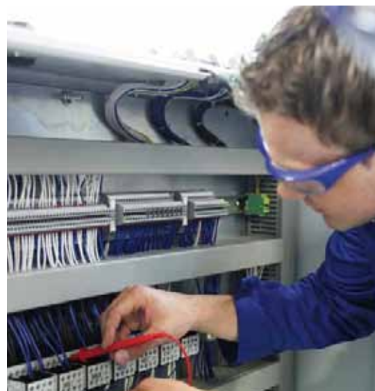
Prüfung einer Steuerungskomponente