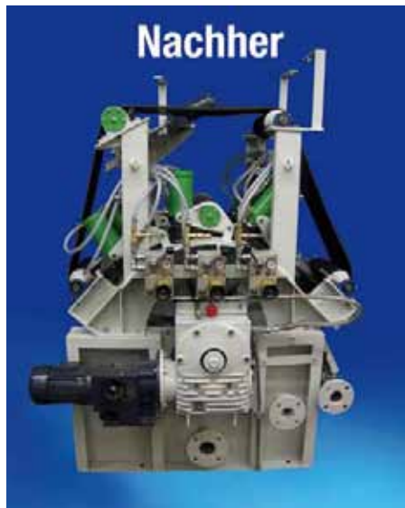
Pressbandtrommelfilter mit neuer Pneumatik und Antriebstechnik (vor und nach der Generalüberholung)