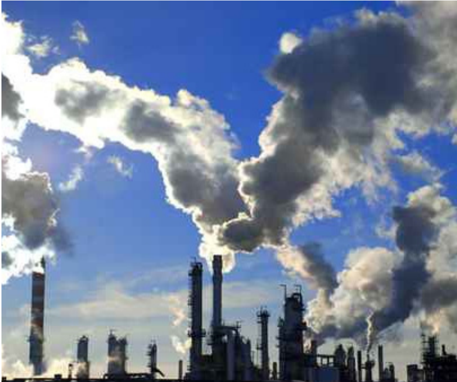
Analysensysteme – integraler Bestandteil in der Prozessindustrie

System“ (SIS) eingesetzt wird, oder Anforderungen an eine Schutzeinrichtung nach DIN EN 61511 erfüllen müssen – wir haben die passende Systemlösung für Sie.