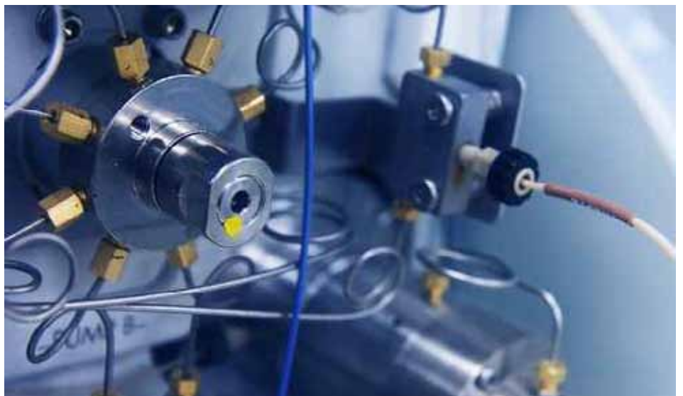
Eingangsventil eines Gaschromatographen

Wann immer Sie ein Online-Analysensystem benötigen, das in einem „Safety Instrumented